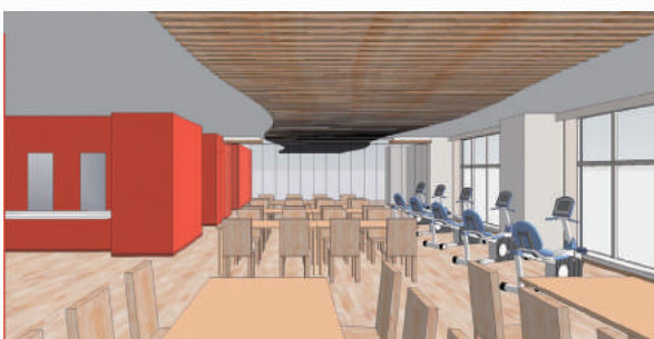
デイケアフロア(パース図)

これからますます進む高齢化社会において、厚生労働省の掲げる「地域包括ケア構想」の最も重要なキーである「生活の場を守る」ために、今まで培った千春会のノウハウに加えて、「想像力」や「冒険心」をもって新しい事業に「挑戦」し、「魔法」のように地域のみなさまの笑顔を増やす「夢」を叶えられるように頑張ってお参りますのでどうぞご期待下さい。