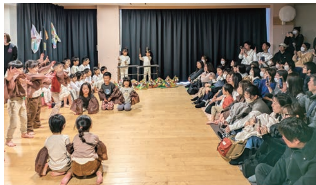
たくさんの保護者の前で発表する園児たち

大きな声で堂々とセリフもしっかり言えた5歳児さん。年齢の小さい園児さんは、可愛らしい声で、リズムをとって歌やお遊戯を見てもらい、それぞれに緊張しながらも立派な姿に、保護者の皆さんも嬉しそうに見守っておられました。