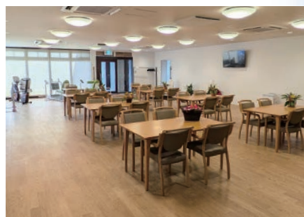
2F 機能訓練特化型デイケア