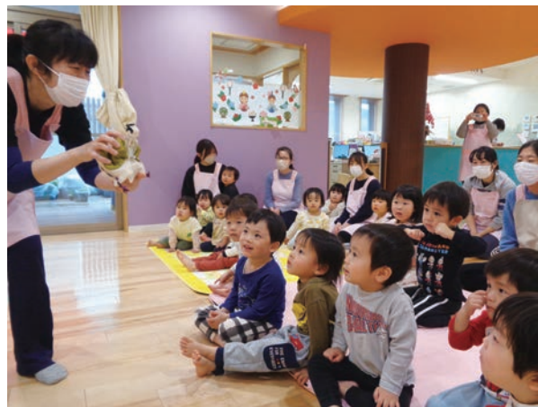
ひな人形に目を輝かせる子どもたち