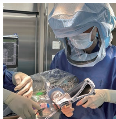
手術支援ロボットを使った人工関節の手術現場

この手術ロボットは、手術担当医師の制御下で動作し、連動する赤外線カメラが人間の目では捉えきれないブレを捉え、一人一人異なる関節の状態を検知して正確に認識します。手術中も画像で確認しながら、正確に骨を削る角度や大きさ、量の補正を行いながら進行しますので、それぞれの膝の状態に応じた手術が可能です。